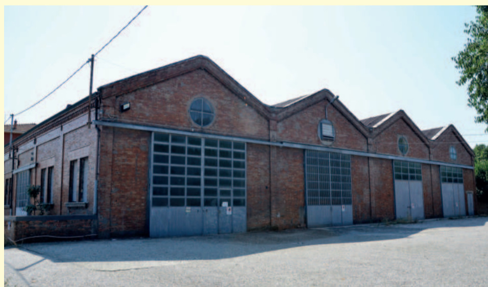
Le Ex Officine, destinate a spazi per la cultura e all'archivio comunale. Il progetto di restauro è al vaglio della Soprintendenza ai Beni Culturali.

Alle risorse PNRR direttamente assegnate a Medicina si aggiungono quelle ottenute dal lavoro congiunto dei 10 Comuni del Nuovo Circondario Imolese . Nello specifico parliamo di oltre 2 milioni di euro destinati al welfare per il sostegno alle famiglie, alla povertà estrema, alla disabilità e per potenziare i servizi sociali domiciliari . Sono invece 3 milioni di euro le risorse ottenute per lo sviluppo digitale , la migrazione in cloud dei servizi , la digitalizzazione dell'ambito tecnico e dei servizi a vantaggio dei cittadini . Con questi ultimi fondi, tra le altre cose, si andrà a rifare il sito internet comunale, adeguandolo alle ultime linee guida riguardanti i portali web comunali.