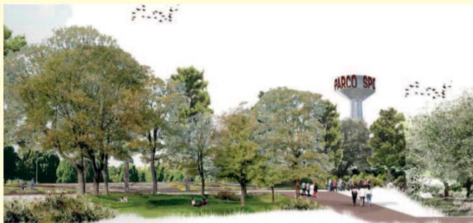
Un rendering del progetto Parco dello Sport, i cui lavori inizieranno entro la fine dell'anno.