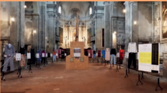
Festa della Donna, mostra "Com'eri vestita?"