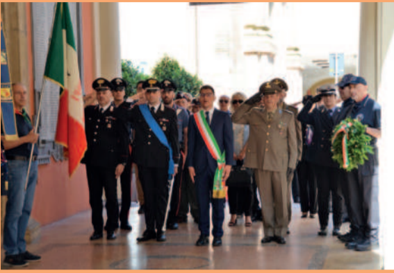
Festa della Repubblica, 2 giugno 2023