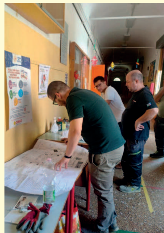
Lavori in corso nella scuola primaria "Vannini".