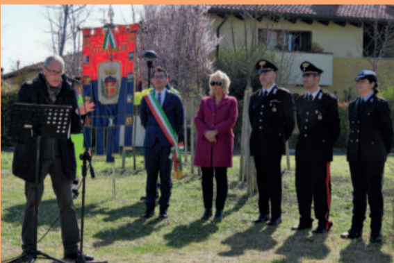
Il ricordo delle vittime del Covid, 16 marzo 2023