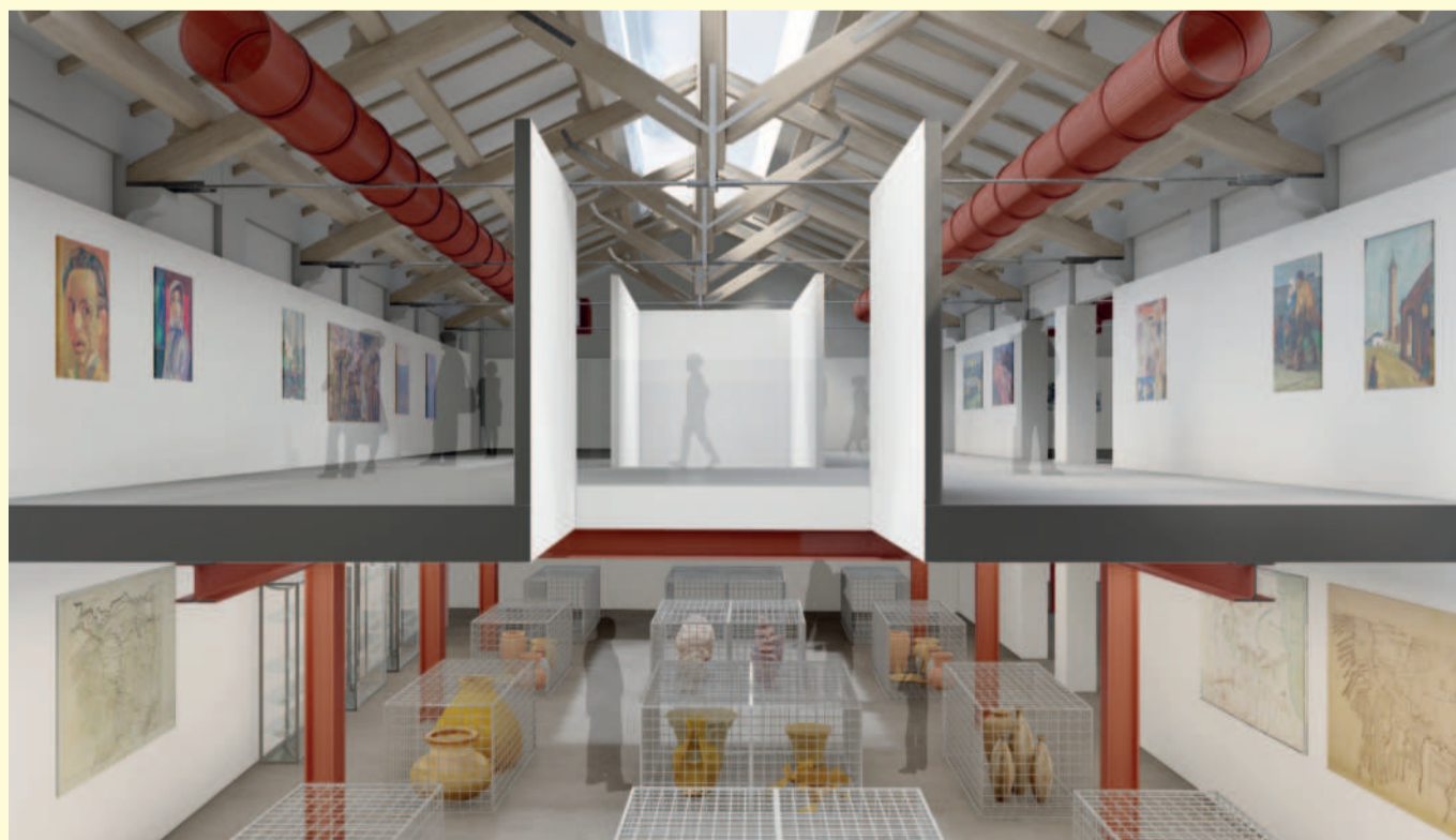
Rendering delle Nuove Officine della Cultura.