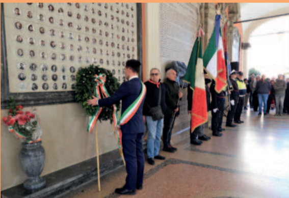
78° Anniversario della Liberazione, 16 e 25 aprile 2023